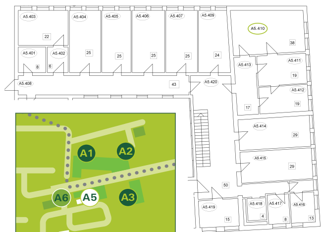
Sommerschulen Sibirien | Stammgebäude A5 | OG - Zi. 410

HOCHSCHULE WEIHENSTEPHAN-TRIESDORF SOMMERSCHULEN SIBIRIEN Fakultät Landschaftsarchitektur Am Hofgarten 6 85354 Freising | Germany